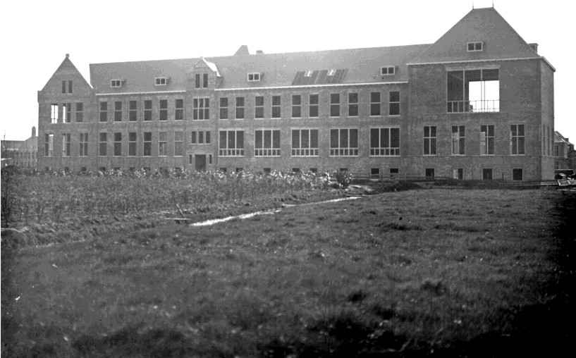
Het 'oude' Anatomisch Laboratorium aan de Wassenaarseweg 62 te Leiden in aanbouw, 1922.