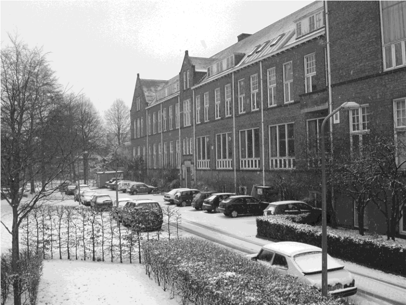
Het 'oude' Anatomisch Laboratorium aan de Wassenaarseweg 62 te Leiden (Foto: J. Lens; 2001).